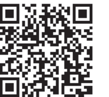
商談マッチングシステムについての説明サイト