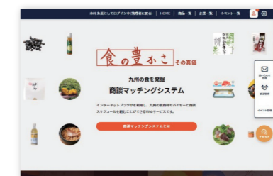
商談マッチングシステムwebページ